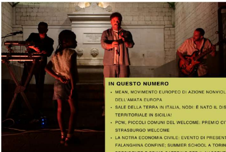
Foto notizia del mese: Concerto di "Osso Sacro" a Sassinoro per la Giornata Mondiale del Rifugiato